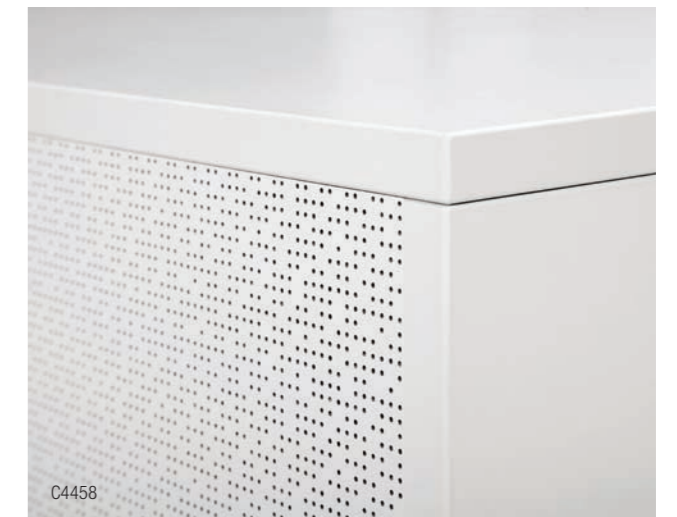
MELAMIN RÜCKWAND ODER FRONT IN DER OPTION AKUSTIK