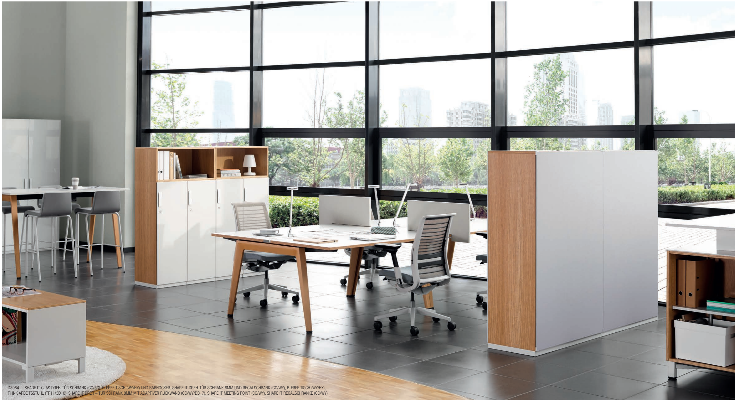
D3084 | SHARE IT GLAS DREH-TÜR SCHRANK (CC/5G), B-FREE TISCH (WY/HX) UND BARHOCKER, SHARE IT DREH-TÜR SCHRANK 8MM UND REGALSCHRANK (CC/WY), B-FREE TISCH (WY/HX), THINK ARBEITSSTUHL (TR11/3D10), SHARE IT DREH-TÜR SCHRANK 8MM MIT ADAPTIVER RÜCKWAND (CC/WY/DB17), SHARE IT MEETING POINT (CC/WY), SHARE IT REGALSCHRÄNKE (CC/WY)