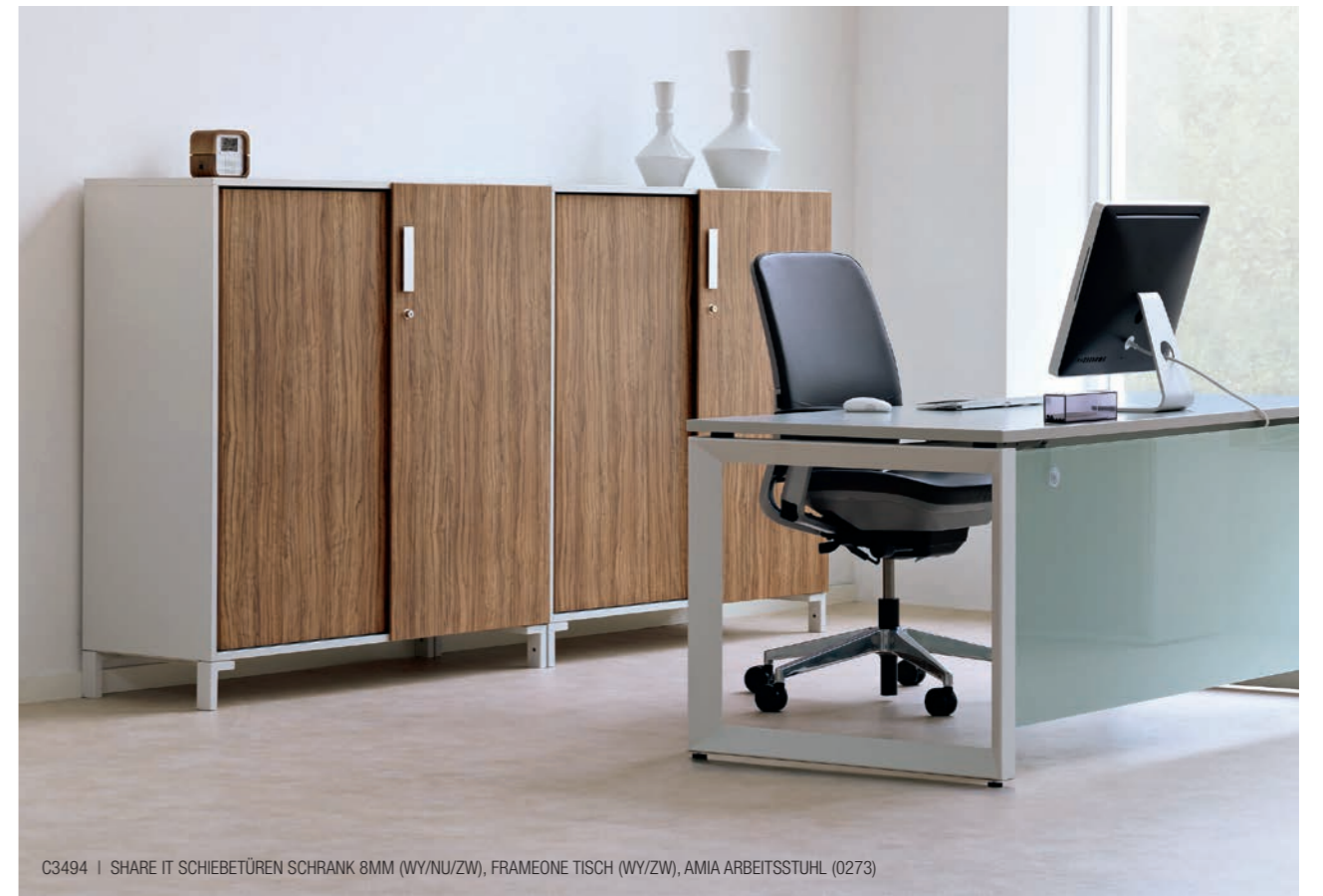
C3494 | SHARE IT SCHIEBETÜREN SCHRANK 8MM (WY/NU/ZW), FRAMEONE TISCH (WY/ZW), AMIA ARBEITSSTUHL (0273)

Share It zeigt sich immer und überall von seiner eleganten Seite – in jeder Arbeitsumgebung. Diese Produktfamilie sorgt für das richtige und inspirierende Ambiente eines modernen Büros.