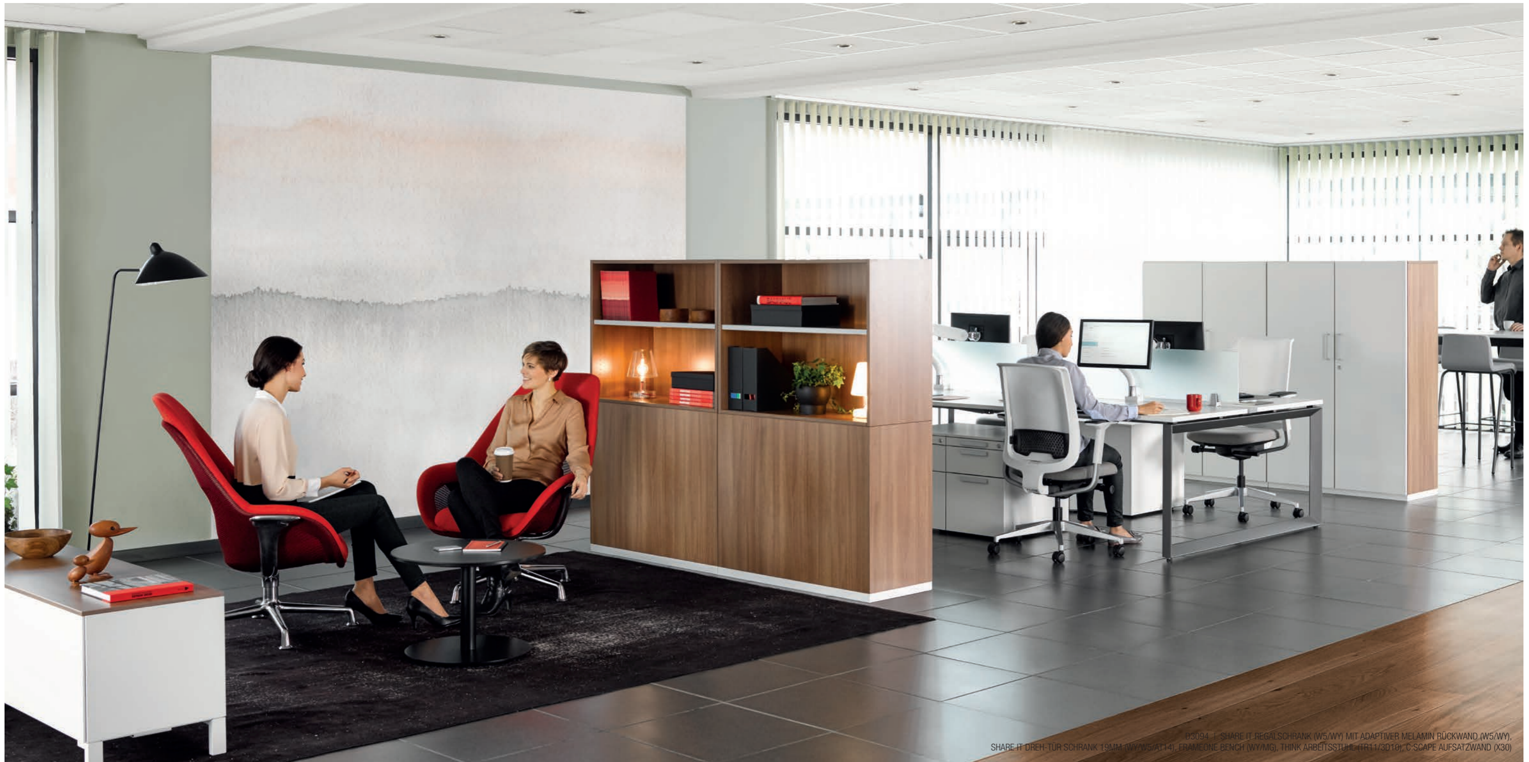
D3094 1 SHARE IT REGALSCHRANK (W5/WY) MIT ADAPTIVER MELAMIN RÜCKWAND (W5/WY), SHARE IT DREH-TÜR SCHRANK 19MM (WY/W5/AT14), FRAMEONE BENCH (WY/MG), THINK ARBEITSSTUHL (TR11/3D10), C-SCAPE AUFSATZWAND (X30)