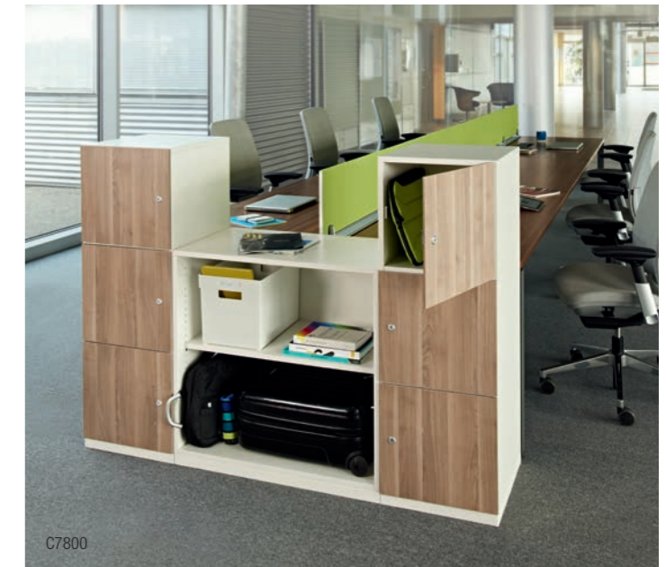
WERTFÄCHER FÜR NOMADEN