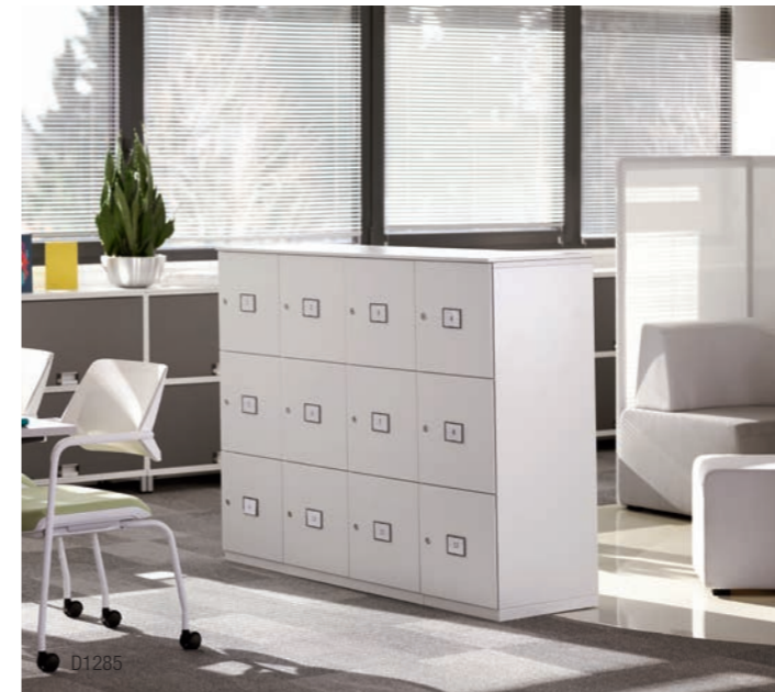
WERTFÄCHER FÜR SOZIALEN TREFFPUNKT

In den Share It Wertfächern lassen sich persönliche oder gemeinschaftlich genutzte Gegenstände einfach und sicher verstauen - so bleibt der Kopf frei für den Arbeitsalltag.