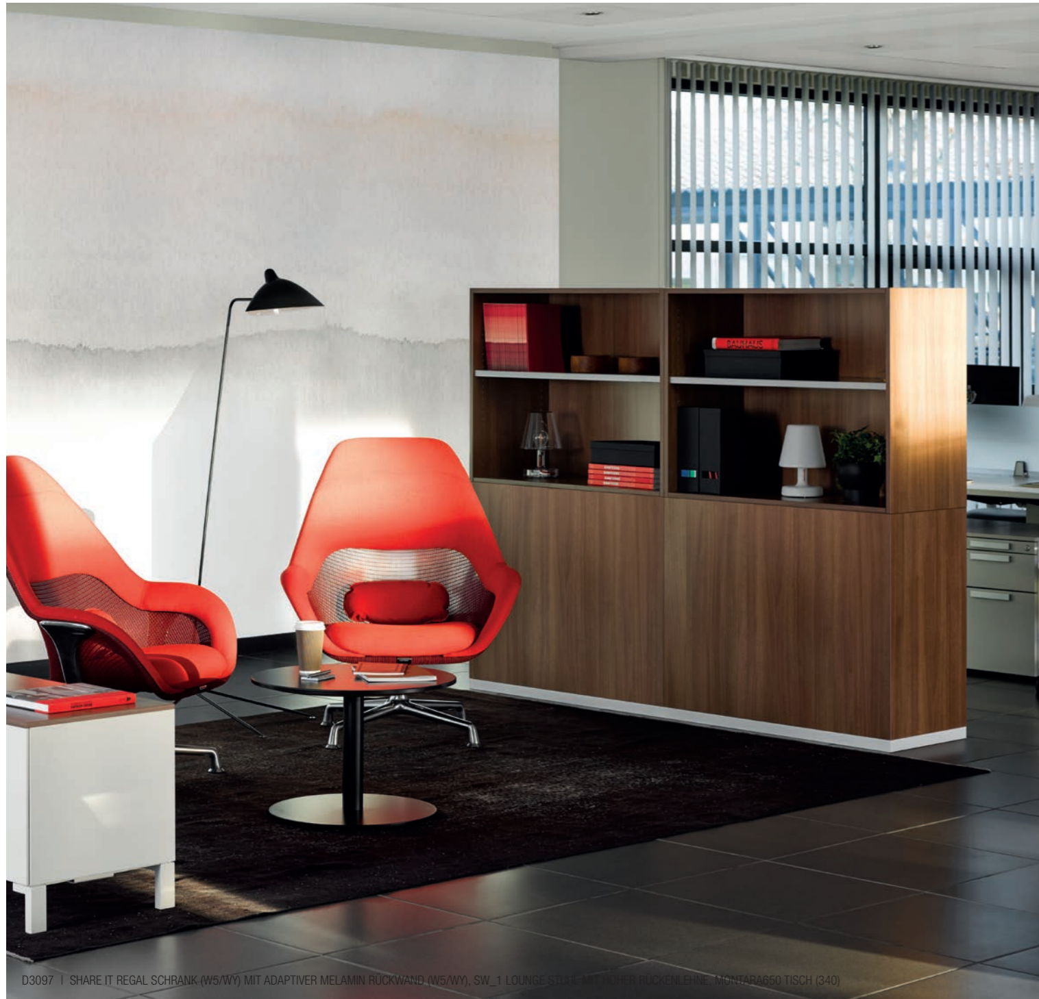
D3097 | SHARE IT REGAL SCHRANK (W5/WY) MIT ADAPTIVER MELAMIN RÜCKWAND (W5/WY), SW_1 LOUNGE STUHL MIT RICHTER RÜCKLEHNE, MONTARA650 TISCH (340)