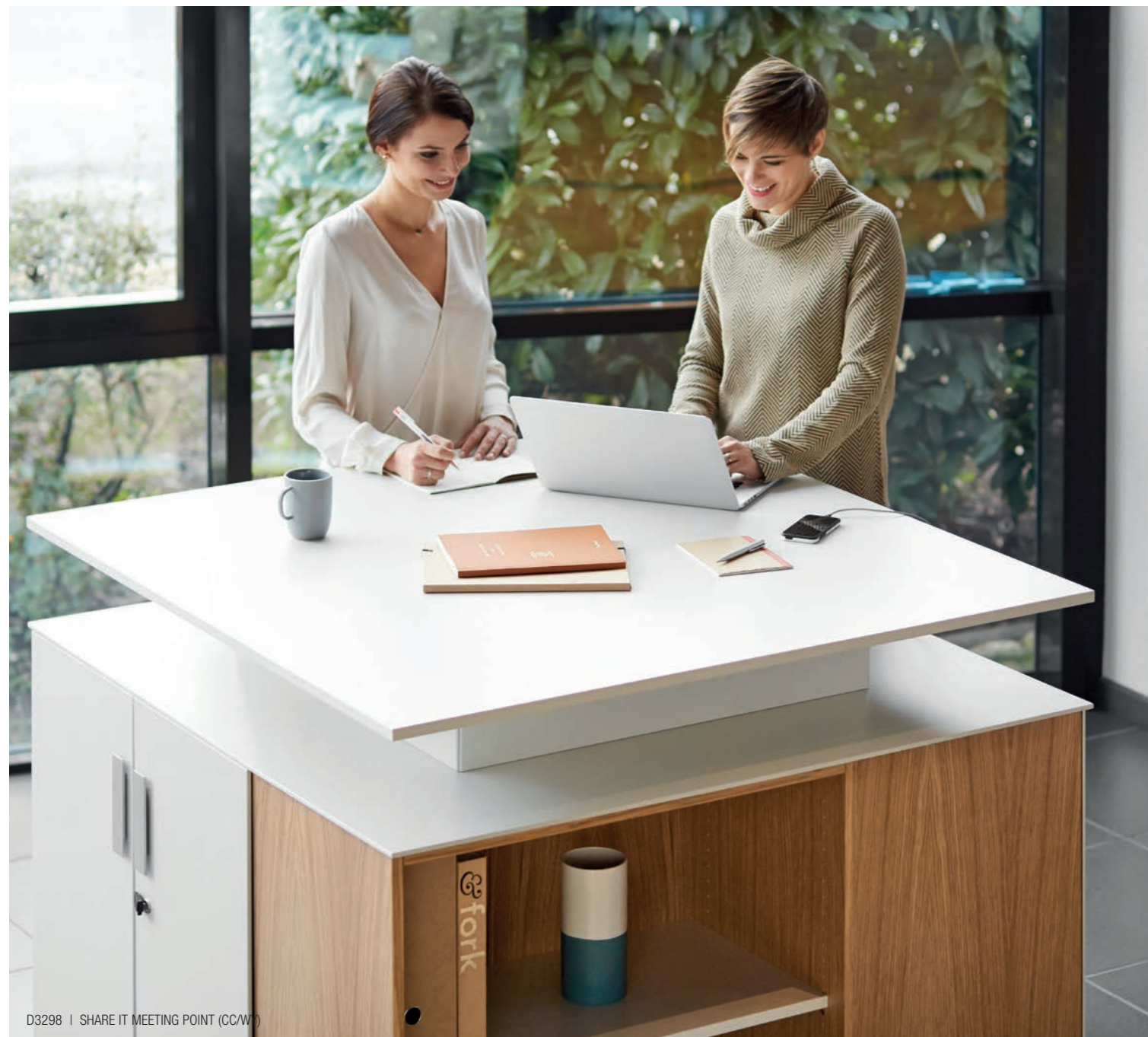
D3298 | SHARE IT MEETING POINT (CC/W)

Beschreibbare Glasfronten werden bei Besprechungen zur interaktiven Informationsfläche.