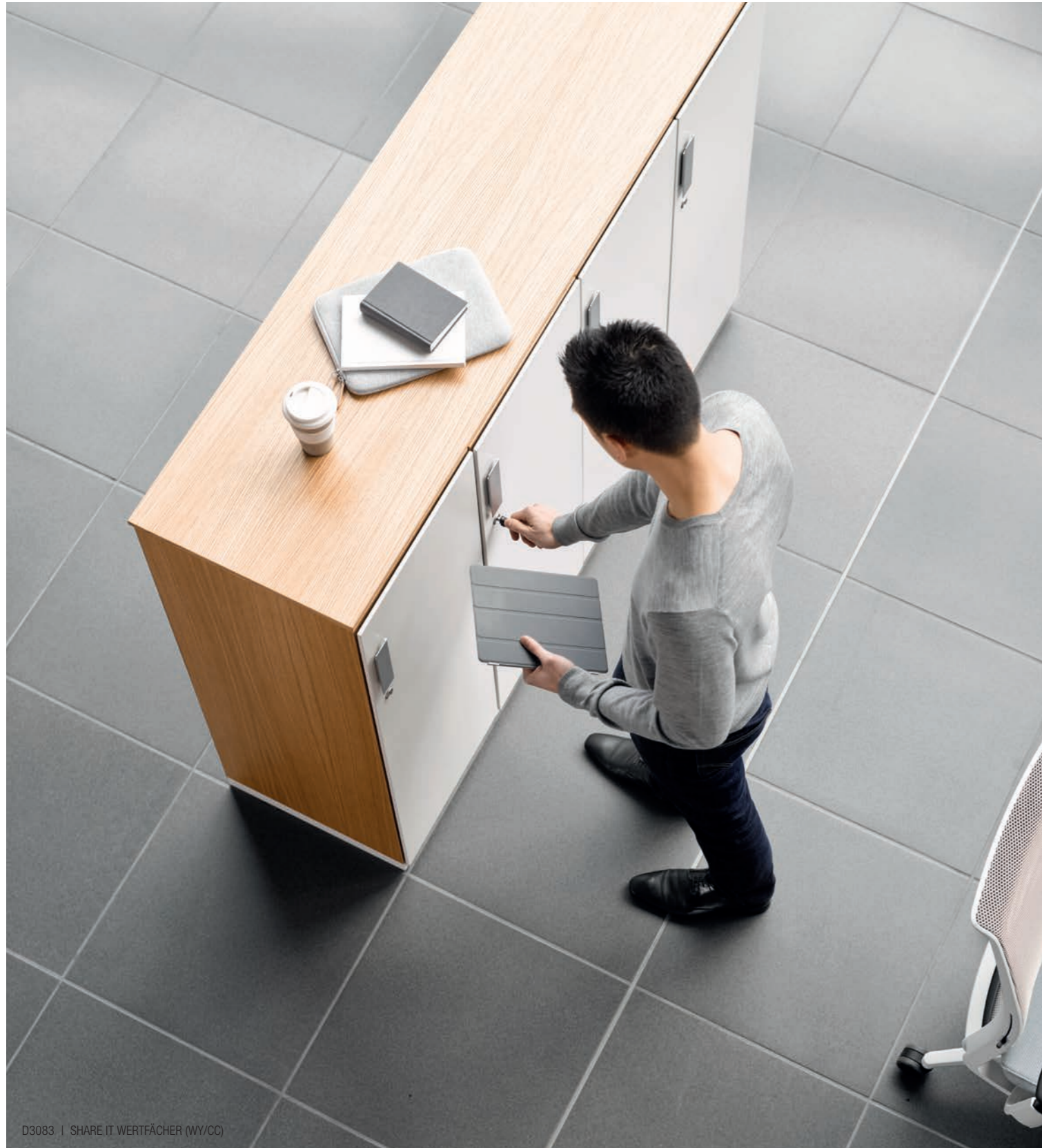
D3083 | SHARE IT WERTFÄCHER (WY/CC)